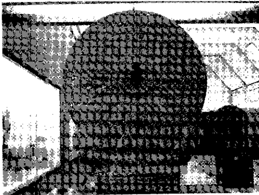
รูปที่ 1. ธรรมจักรจากเทวสถาน กรุงเทพมหานคร

ลวดลายที่น่าสนใจเป็นอย่างยิ่งประการหนึ่งที่มีมักจะปรากฏอยู่ในบริเวณพื้นที่ดังกล่าวคือ รูปบุคคลเพศชาย ทรงเครื่องในวาระกษัตริย์ประทับนั่ง ในพระหัตถ์ทั้งสองข้างทรงถือดอกบัว (ปัทมา) โดยได้ธรรมจักรที่ปรากฏลวดลายเช่นนี้พบอยู่กลุ่มหนึ่งในเขตคู่มแม่น้ำเจ้าพระยา โดยเฉพาะในจังหวัดนครปฐม ธรรมจักรชิ้นที่มีกรกล่าวถึงมากที่สุด คือ ธรรมจักรจากเทวสถาน กรุงเทพมหานคร (รูปที่ 1) ซึ่งได้ปรากฏรูปบุคคลในลักษณะดังกล่าวอยู่ใต้ดมล้อของวงจักร และมีรูปคนแคระขนาบอยู่ทั้งสองข้างของพระองค์ ในอิริยาบถของการแบกกงล้อ หรือธรรมจักรไว้