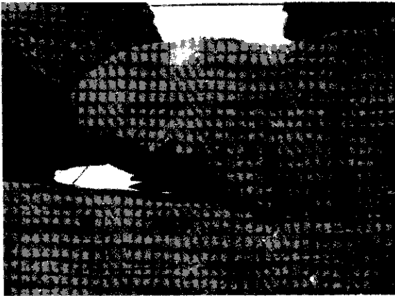
รูปที่ 4. ภาพขยายส่วนกุซุชั้นบนสุดของฐานธรรมจักรศิลาจากจังหวัดนครปฐม

อย่างไรก็ดี ที่บริเวณส่วนกลางของผนังธรรมจักรชั้นนี้แต่ละด้าน ได้มีการยกกระเปาะราวกับเป็นเครื่องเน้นย้ำความสำคัญของรูปบุคคลที่ประดับอยู่ภายในซุ้มชั้นบนสุด โดยรูปบุคคลดังกล่าวได้แสดงเป็นรูปพระสุริยะ ดังจะเห็นได้จากการที่ทรงดอกบัวไว้ในพระหัตถ์ทั้งสองข้าง แต่ปรากฏให้เห็นเฉพาะครึ่งพระวรกายส่วนบนเช่นเดียวกับที่ปรากฏอยู่ในชั้นส่วนธรรมจักรที่ระเบียงวิหารคด พระปฐมเจดีย์ (รูปที่ 4) ลักษณะเช่นนี้ย่อมแสดงให้เห็นถึงความขัดแย้งกับทฤษฎีของ บรรานัน เนื่องจากแนวคิดเรื่องโลกศาสตร์ตามคติอินเดีย นั้น เชื่อว่าพระอาทิตย์มีวงโคจรอยู่เหนือยอดเขาเขาคันธร ได้ส่วนยอดของเขาพระสุเมรุ 26 ดังนั้นฐานธรรมจักรชั้นนี้จึงอาจจะไม่เกี่ยวข้องกับคติเรื่องสวรรค์ชั้นดาวดึงส์ตามที่ บรรานัน สันนิษฐานไว้ แต่อาจจะเกี่ยวเนื่องกับคติเรื่องวิมานของพระสุริยเทพมากกว่า