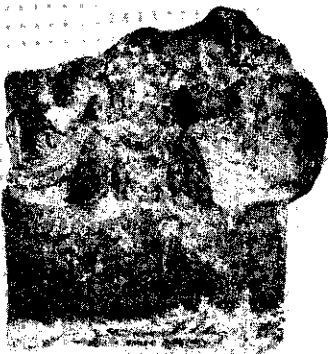
รูปที่ 2. ชิ้นส่วนธรรมจักรที่ระเบียงวิหารคด พระปฐมเจดีย์ จังหวัดนครปฐม ที่มา : ธนิต อยุธยา, ธรรมจักร, รูปที่ 24.

รูปพระสุริยะที่น่าสนใจที่สุดอีกรูปหนึ่งในธรรมจักรศิลาศิลปะทวารวดีพบในชิ้นส่วนธรรมจักรทำจากหินปูน ที่ระเบียงวิหารคด พระปฐมเจดีย์ จังหวัดนครปฐม (รูปที่ 2) ลักษณะพิเศษของประติมากรรมชิ้นนี้ คือ รูปพระสุริยะที่ปรากฏอยู่ได้คุมธรรมจักรปรากฏเพียงครั้งพระวรกายส่วนบน ในพระหัตถ์ทั้งสองทรงดอกบัว โดยอาจจะสังเกตได้ว่าที่เบื้องหลังของพระองค์ปรากฏมีปีกยื่นออกมาทั้ง 2 ข้าง ของพระวรกาย