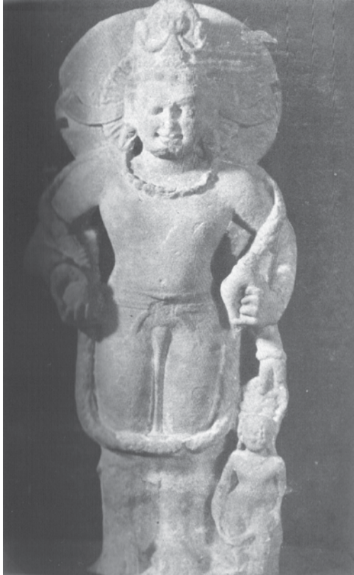
ภาพที่ 8: เทวรูปวิษณุจากเมือง Unchdih จัดแสดงในพิพิธภัณฑน์ เมืองอัลลาห์อับัด (Allahabad) ที่มา: หนังสือ The Art and Iconography of Vishnu-Narayana ภาพที่ 8 (ไม่ระบุหน้า)