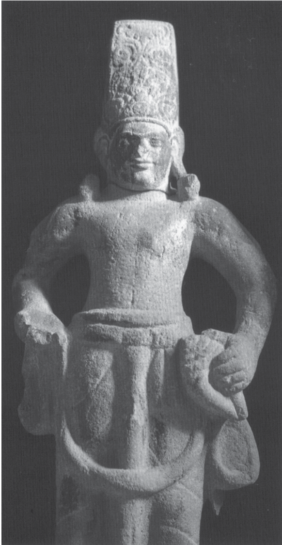
ภาพที่ 3: เทวรูปพระวิษณุที่วัดพระเพรง