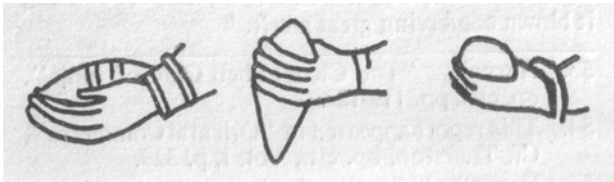
ภาพที่ 7: การถือสังข์เทวรูปวิษณุสมัยมถุรา