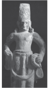
..... ประติมากรรมเทวรูปพระวิษณุ จากอำเภอไชยา จังหวัดสุราษฎร์ธานี วิษณุ สมบุญปิติ