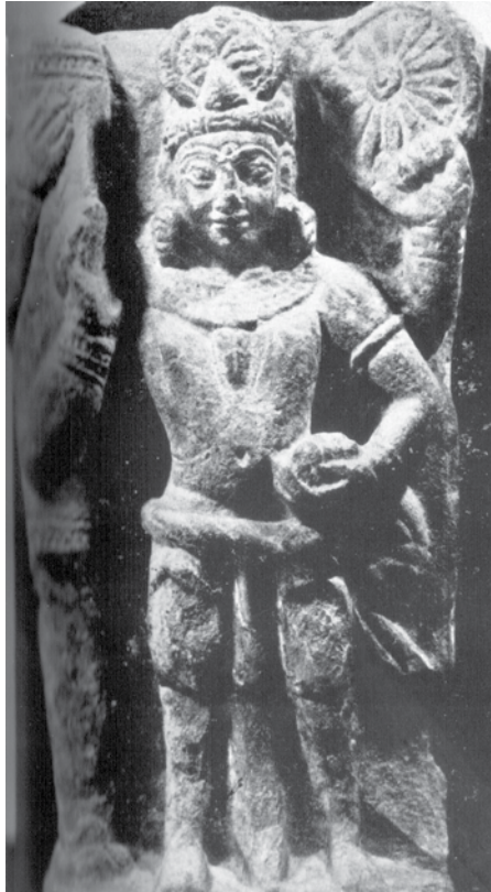
ภาพที่ 6: เทวรูปวิษณุสมัยมถุรา