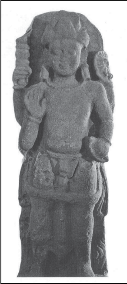
ภาพที่ 4: เทวรูปศิลาพระवासเทพ-กฤษณะ ที่มา: หนังสือรากเหง้าแห่งศิลปะไทย หน้า 12