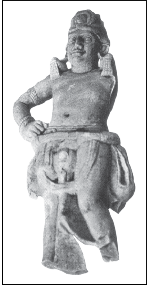
ภาพที่ 5: ประติมากรรมศิลาพระโพธิสัตว์ปัทมปาณี