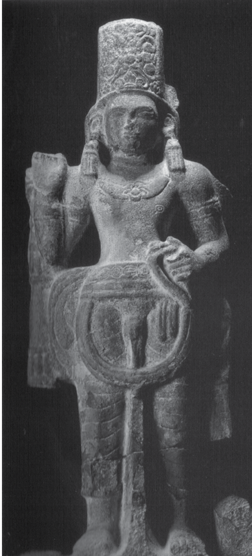
ภาพที่ 1: เทวรูปพระวิษณุ อำเภอลำไทร จังหวัดสุราษฎร์ธานี