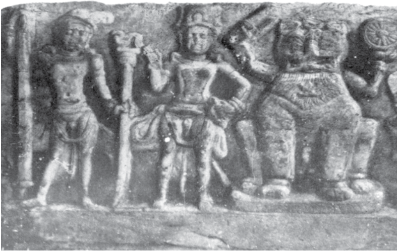
ภาพที่ 2 : เทวรูปวิษณุสมัยอมราวดีตอนปลาย ที่มา : หนังสือ Art of South India - Andhra Pradesh ภาพที่ 13 (ไม่ระบุหน้า)